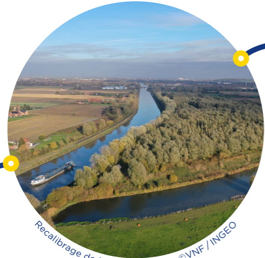
Recalibrage de la Lys mitoyenne

Fruit d'une démarche collaborative et concertée associant citoyens, élus, entreprises et acteurs associatifs dans tous les territoires concernés, la mise en place de Seine-Escaut renforce les liens entre acteurs locaux.