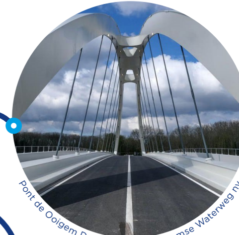
Pont de Ooigem Desselgem