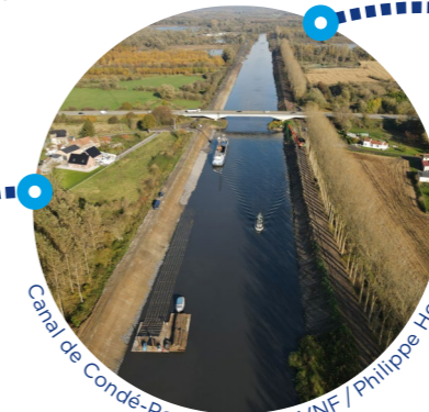
Canal de Condé-Pommeroeul