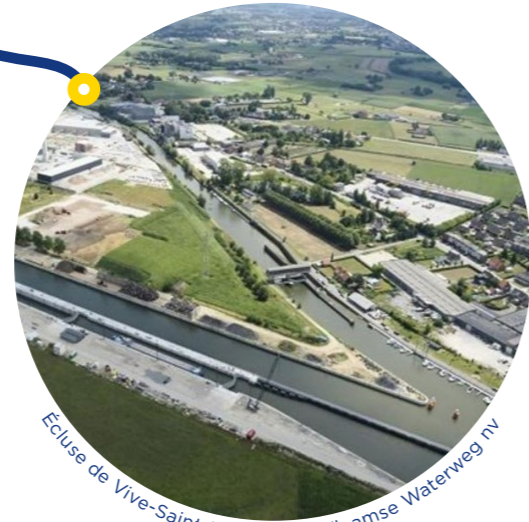
Ecluse de Vive-Saint-Bavon

Concrétisé par le lancement de programmes d'envergure, Seine-Escaut est porteur de transformations durables pour les infrastructures fluviales et les territoires dans lesquels elles s'inscrivent. Il contribue ainsi à l'amélioration du cadre de vie et à la valorisation du patrimoine.