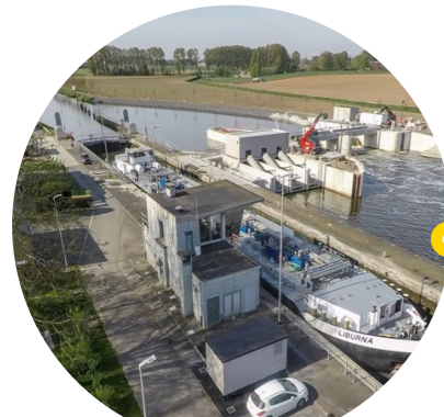
Barrage d'Hérinnes

Projet de développement avant tout, Seine-Escaut va créer les conditions pour que se mette en place autour des voies navigables, à l'échelle aussi bien locale que régionale, nationale et internationale, un écosystème offrant aux territoires de multiples opportunités de création de richesses et d'emplois pérennes.