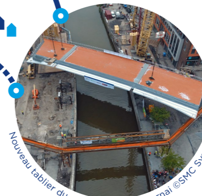
Nouveau tablier du pont-à-Ponts à Tournai

Seine-Escaut apportera une réponse performante et durable aux besoins de mobilité des biens et des personnes en Europe. Il élargira les zones accessibles aux paquebots de croisière et bateaux de plaisance tout en augmentant fortement les échanges de marchandises par voie d'eau. À l'horizon 2035, 150 millions de tonnes de fret devraient circuler chaque année sur le réseau.