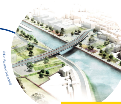
Pont de la Rijsselstraat - Menin