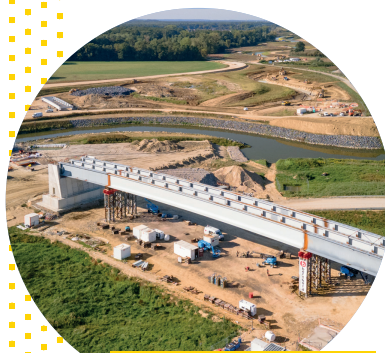
Pont de la RD66 à Montmacq - Cambronne-lès-Ribécourt